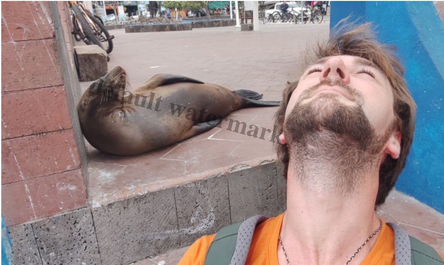
Séance yoga avec la salutation de la truffe au Soleil en bambou

Ma musique « mémoire » du lieu, si tu veux en profiter pendant ta lecture !