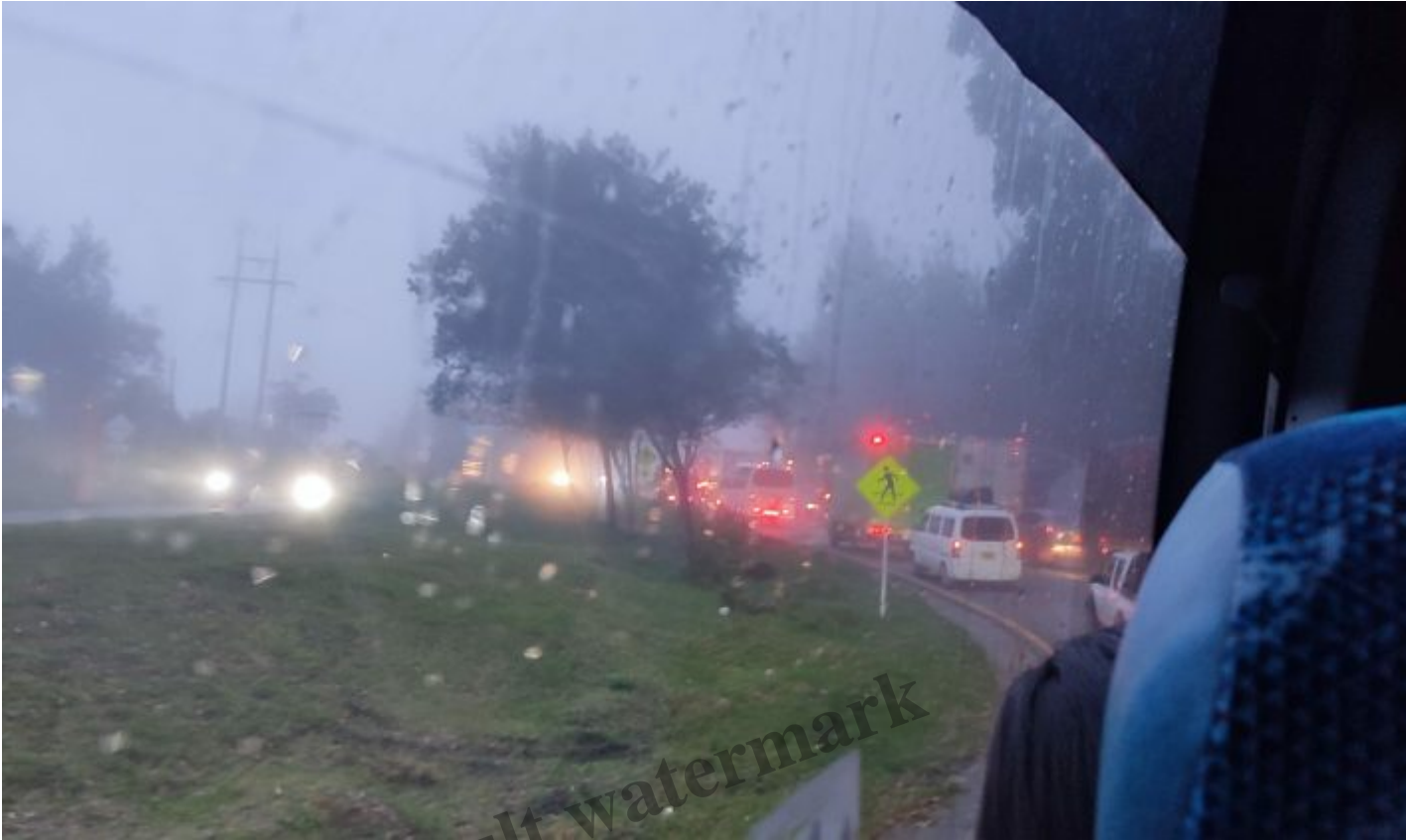
Je n'avais pas pensé être dans des bouchons durant ce voyage