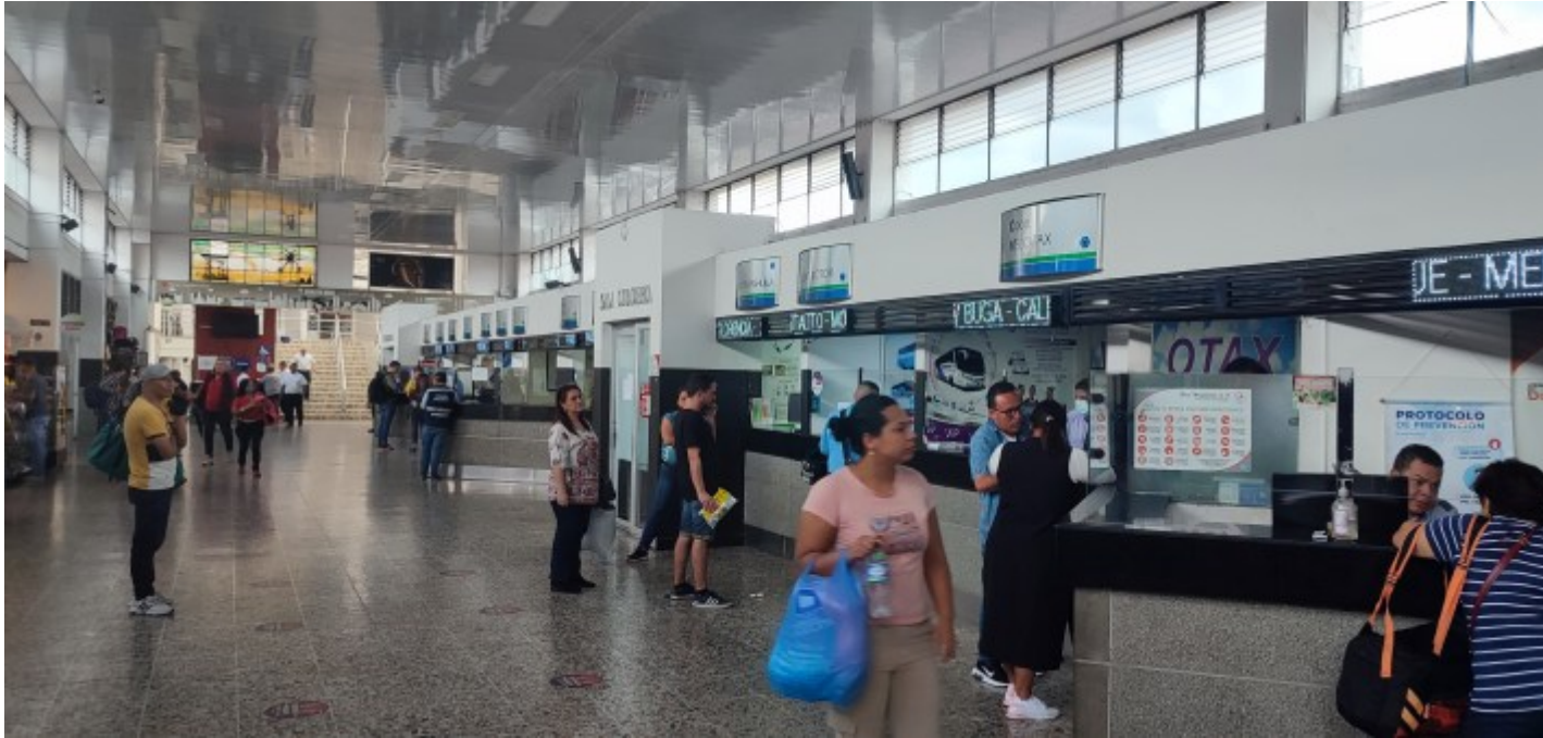
Un terminal avec une trentaine de guichets, si simple...

Un autre bus va jusqu'à la ville d'Ibagué, sur mon chemin. Logiquement à 2h de route, je devrais pouvoir trouver un autre transport jusqu'à Aipe en fin d'après-midi. Je n'arriverai finalement pas avant 1h du matin. Avec le phénomène naturel de La Niña , le pays connaît beaucoup de pluies torrentielles et d'inondations et la route s'est en partie effondrée, forçant une circulation alternée chaotique. Ayant donné mes réserves de nourriture à un grand-père et ses trois petits-enfants qui tout comme moi n'était pas préparé à pareil périple, j'arrive à ma Ibagué affamé. Je me précipite aux différents guichets au cas où une solution se présente à moi, m'évitant de passer la nuit à dormir d'un œil au terminal.