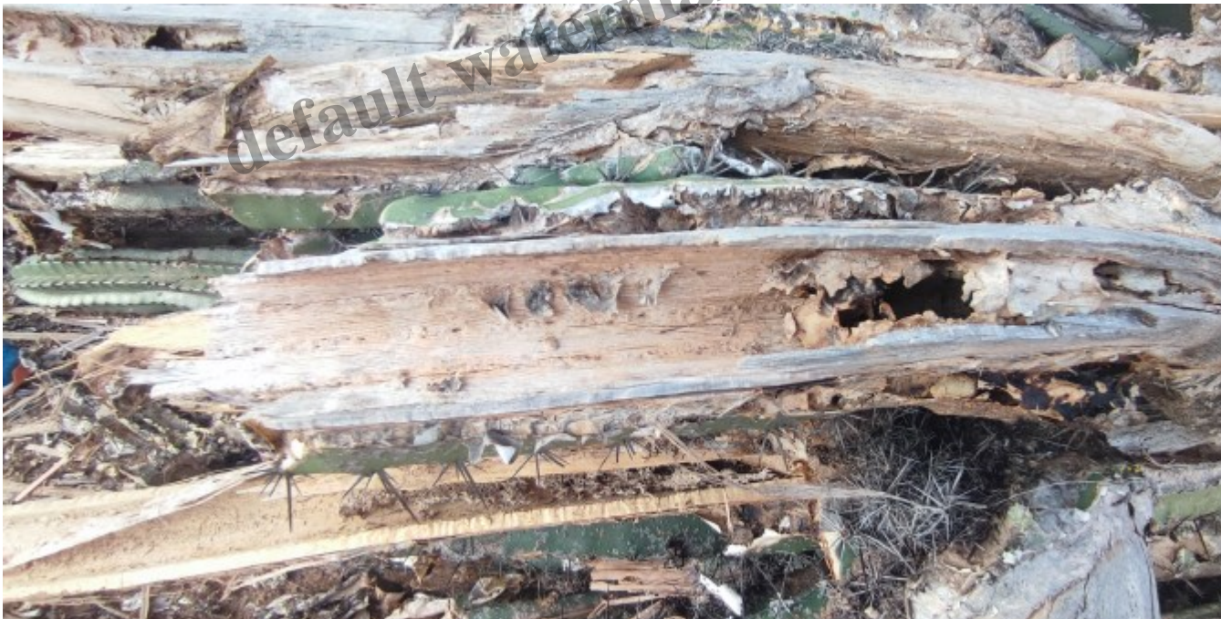
Et je suis sûr que tu ignorais qu'il y avait du bois à l'intérieur