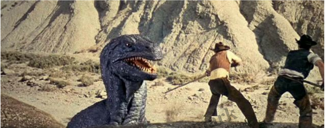
“La Vallée de Gwangi”, un incontournable de votre culture cinématographique avec “Carnosaur 3”

De seulement 330 km 2 (loin des 21 000 km 2 de la Guajira), le désert doit son nom à un serpent à sonnette fréquemment rencontré sur le lieu (je résiste à ne pas mettre de photo exceptionnellement, Chloé, mais je n'en ferai pas une habitude). L'érosion pousse le désert à s'agrandir mais les formations rocheuses sont mises au défi des nombreux touristes qui les parcourent en prenant parfois la liberté de grimper dessus pour une photo quitte à abîmer voire détruire ce qu'ils sont venus apprécier. Logique.