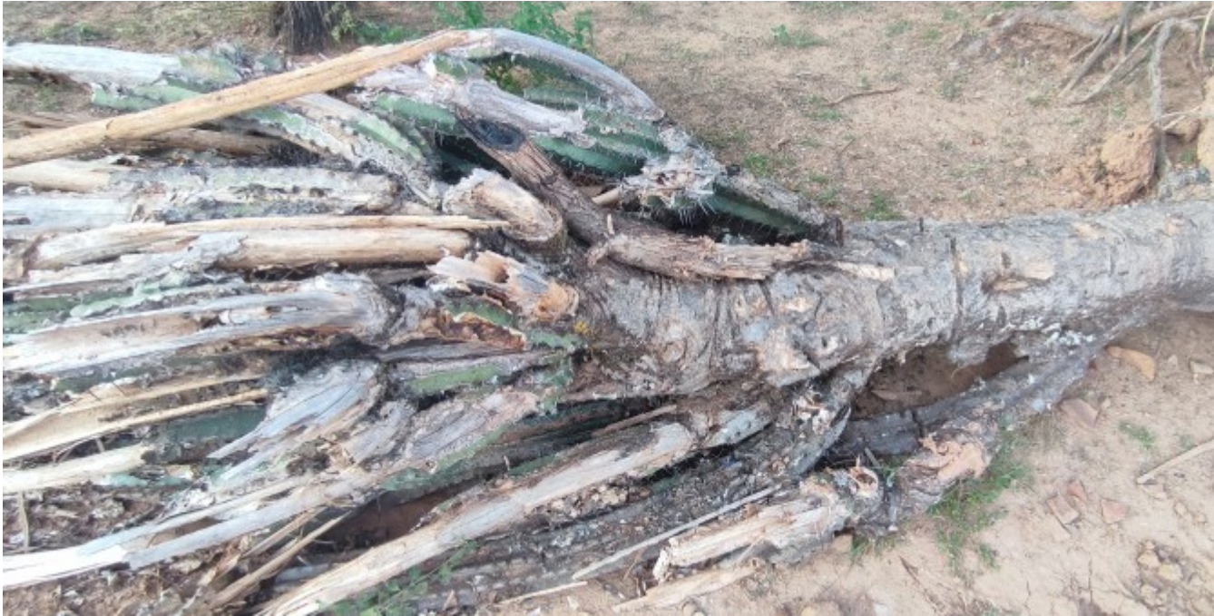
Ceci est un cactus