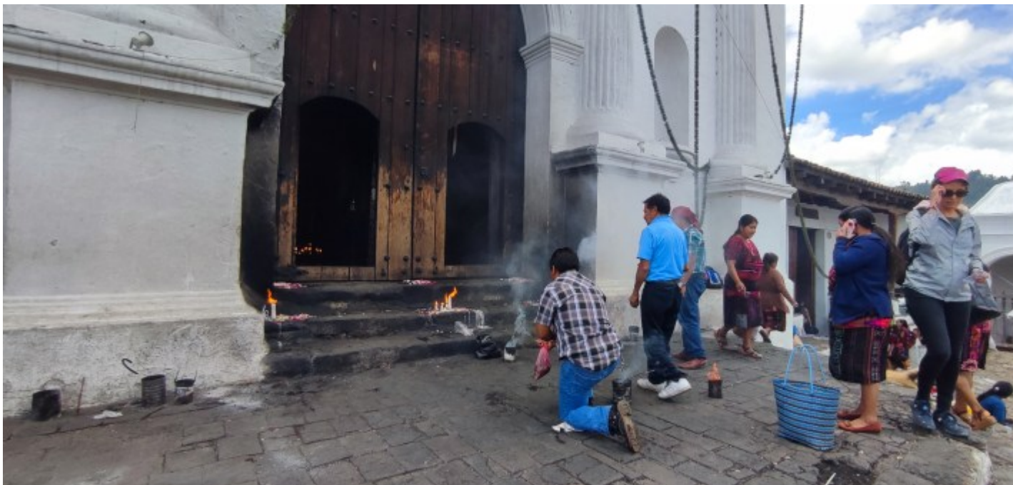
On retrouve les fameux cierges d'ajá rencontrés au Mexique dans la région du Chiapas.

Après une lancha , un premier bus jusqu'à Solola, un deuxième jusqu'à Los Encuentros, le troisième sera le dernier avec pour destination Chichicastenango, village réputé pour être un des marchés si ce n'est le plus grand d'Amérique centrale, deux fois par semaine. L'occasion de voir à nouveau des locaux pratiquer leur religion combinant des rituels mayas et catholiques.