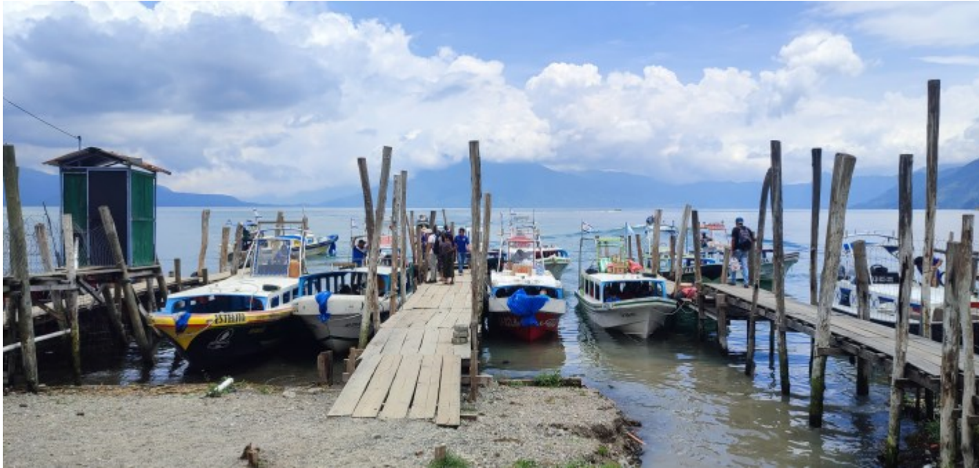
Les quais de Panajachel.

Après une lancha , un premier bus jusqu'à Solola, un deuxième jusqu'à Los Encuentros, le troisième sera le dernier avec pour destination Chichicastenango, village réputé pour être un des marchés si ce n'est le plus grand d'Amérique centrale, deux fois par semaine. L'occasion de voir à nouveau des locaux pratiquer leur religion combinant des rituels mayas et catholiques.