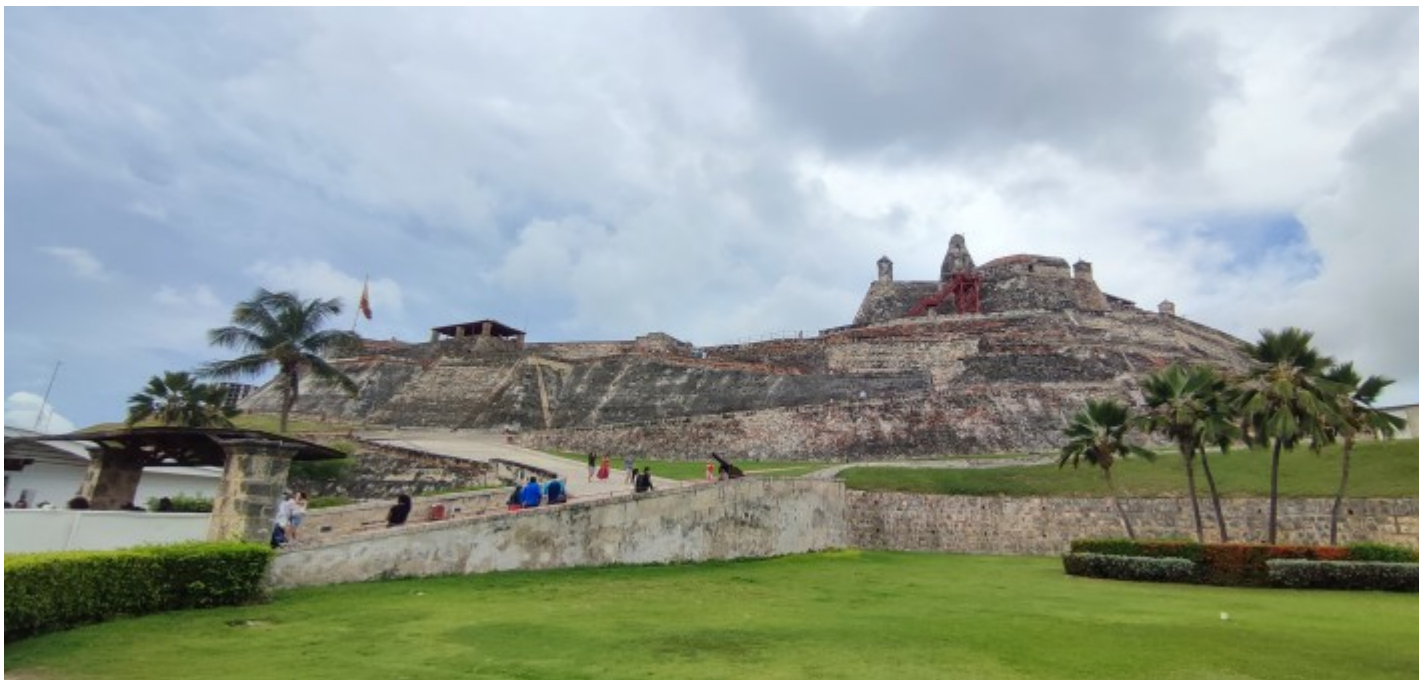
Le fort San Felipe

Son port, notamment négrier, sera vite un point stratégique entre la métropole, les Caraïbes, le Mexique et le Pérou à l'heure de la colonisation. Tu le devines, elle connaîtra également nombreux assauts de pirates et d'autres nations. Vu les nombreuses richesses transitant par la ville, il est vite entrepris de créer le fort aujourd'hui connu sous le nom de San Felipe et 16 kilomètres de murailles en périphérie du centre-ville dont l'accès au port.