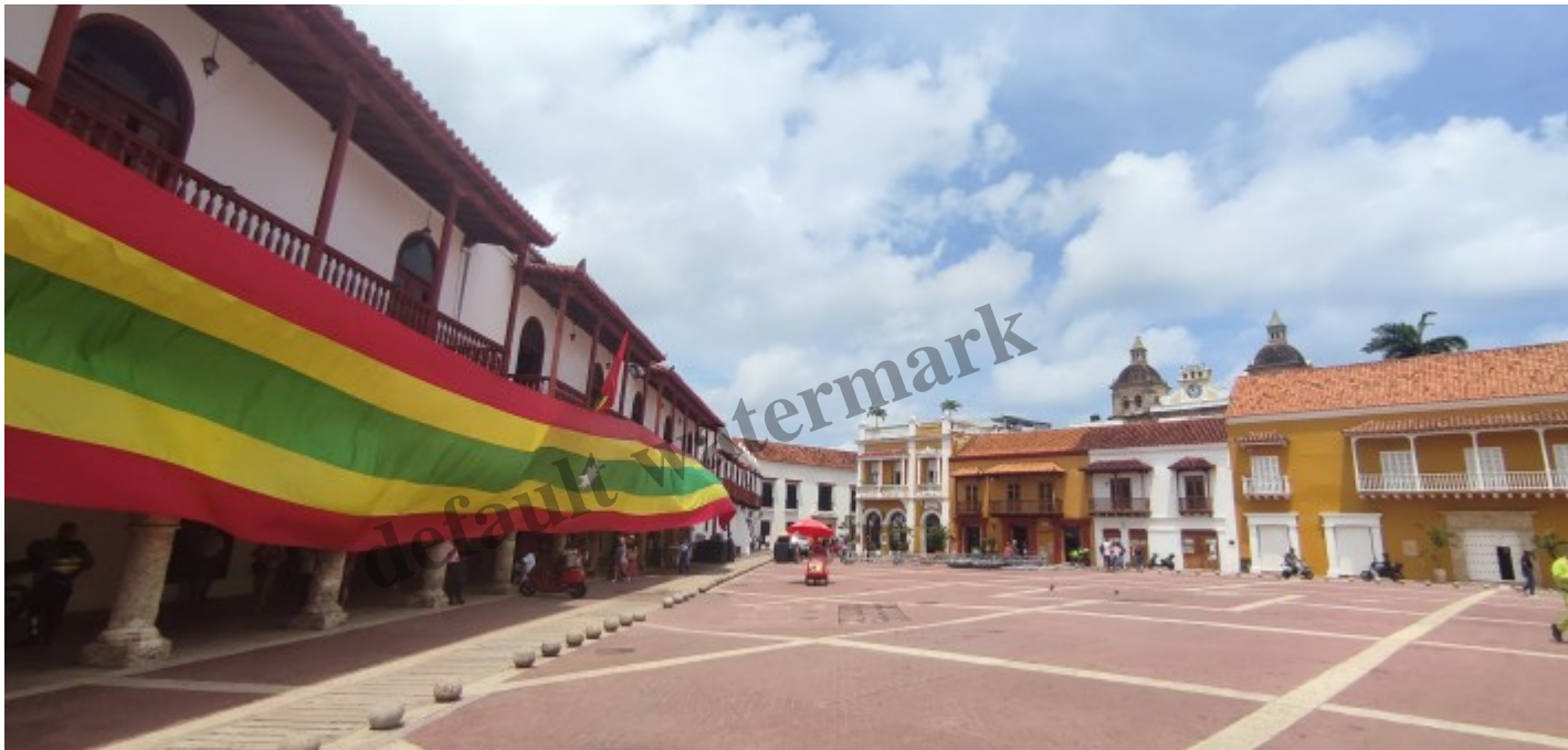
Le drapeau de Carthagène, "la cuadrilonga", utilisé dans toutes les batailles pour l'indépendance du pays

Après 5 ans, le roi d'Espagne revient et veut reconquérir ses territoires. Il missionne Pablo Morino « le pacificateur » (un modèle pour Poutine) pour reprendre la cité sans utiliser la violence. Il décide de fermer la cité (facile avec des murailles). Le peuple refusant de se rendre aussi facilement, il entame une grève de la faim de 100 jours qui fera 400 victimes et donnera la réputation de résistante à sa population. C'est quelques années plus tard que Simon Bolivar permettra à la ville de gagner son indépendance avec celle du pays, en 1819.