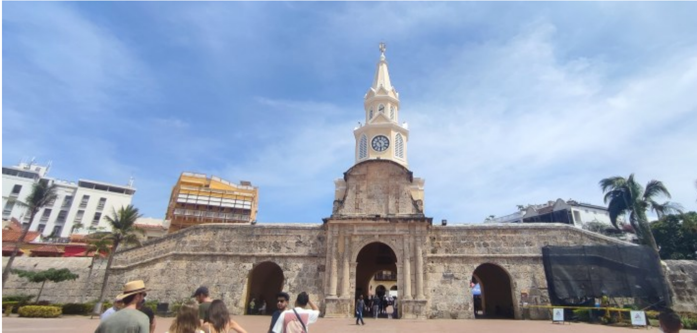
L'entrée du centre historique reconnaissable à son clocher emblématique

Son port, notamment négrier, sera vite un point stratégique entre la métropole, les Caraïbes, le Mexique et le Pérou à l'heure de la colonisation. Tu le devines, elle connaîtra également nombreux assauts de pirates et d'autres nations. Vu les nombreuses richesses transitant par la ville, il est vite entrepris de créer le fort aujourd'hui connu sous le nom de San Felipe et 16 kilomètres de murailles en périphérie du centre-ville dont l'accès au port.