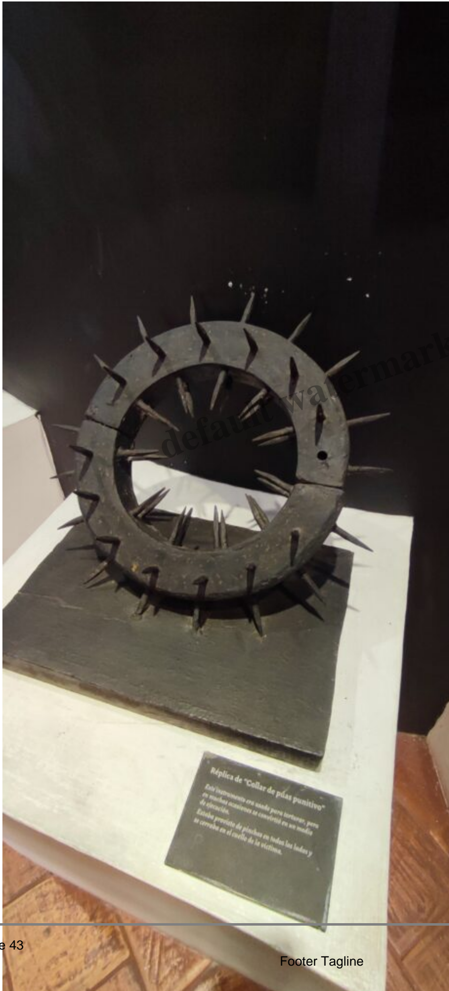
Réplica de "Collar de púas punitivo" Este instrumento era usado para torturar, pero en muchos casos se convirtió en un medio de ejecución. Este tipo proviene de púas en todas las lados y se cerraba en el cuello de la víctima.