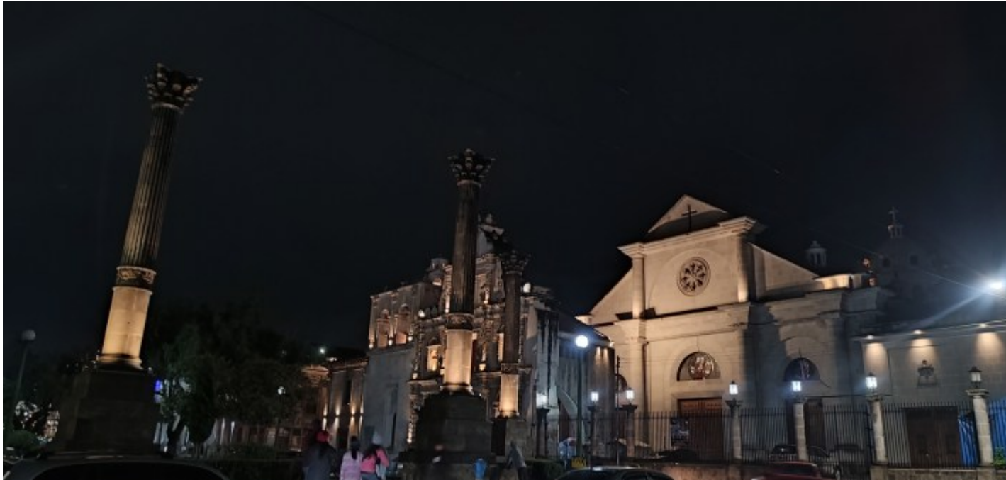
La cathédrale de Quetzaltenango et sa place animée la nuit.