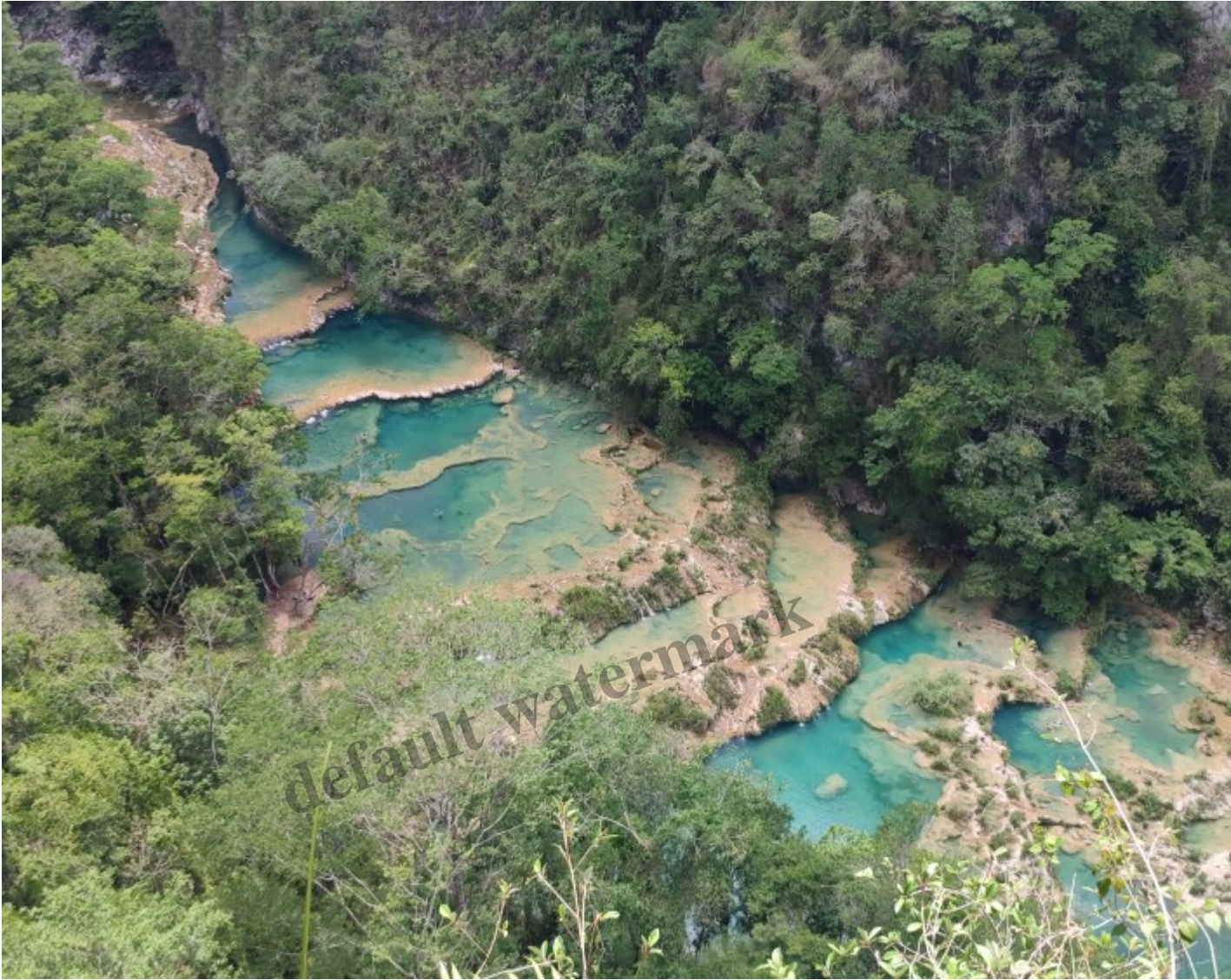
La vue sur les bassins de Semuc Champey.

Cela fait parti du quotidien du backpacker en dehors des sentiers battus je suppose. Les interpellations au marché et au terminal aussi. Tout le monde tente de me faire monter dans un bus que je ne veux pas emprunter, sachant qu'un direct existe pour ma prochaine destination. Je finis par le trouver et me voilà dans un minibus plein à craquer.