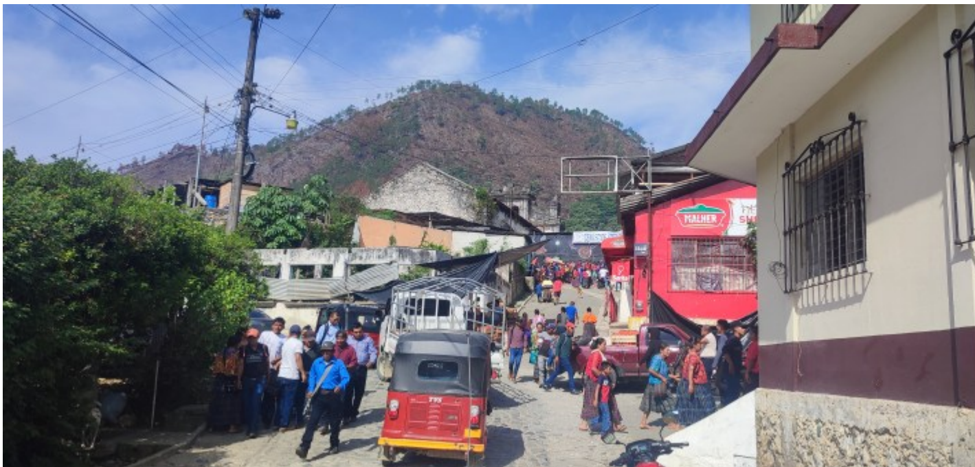
Le village de Lanquin.

Deux activités m'attirent ici : les grottes partiellement immergées à explorer à l'aide d'une simple bougie et les bassins de Semuc Champey. Si le reste de mon temps ici sera dédié à profiter de la magie du lieu au calme pour mon plus grand plaisir, je consacre une journée à ces deux activités. C'est le jour des élections ici qui sont à la fois présidentielles, régionales et municipales. Tous les villages voisins viennent donc voter ce dimanche ce qui causent une sacrée agitation à Lanquin.