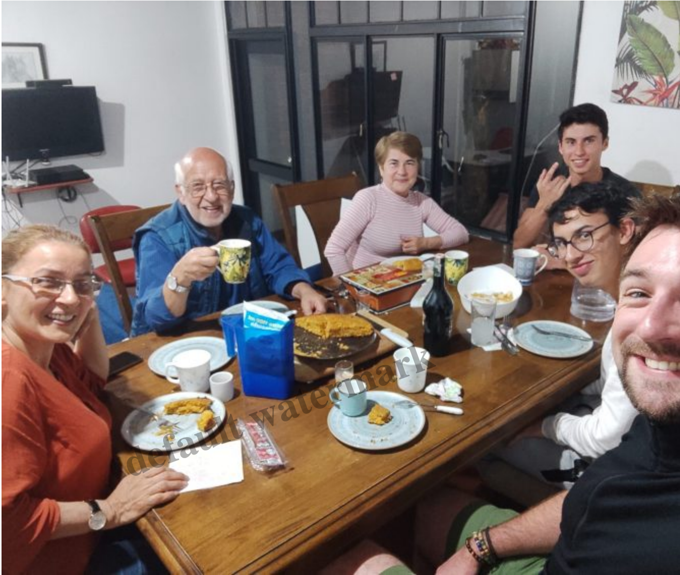
Petit moment familial