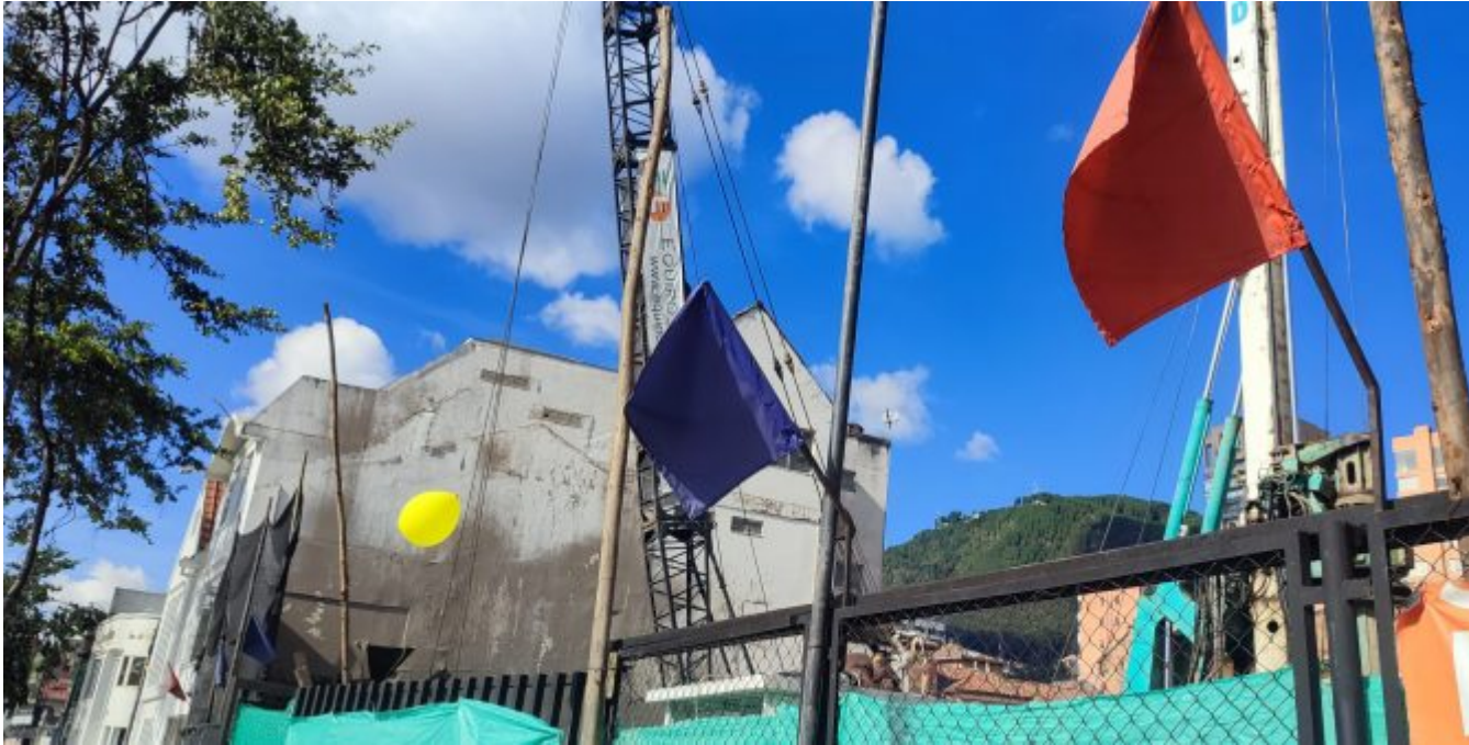
La créativité colombienne, j'adore !