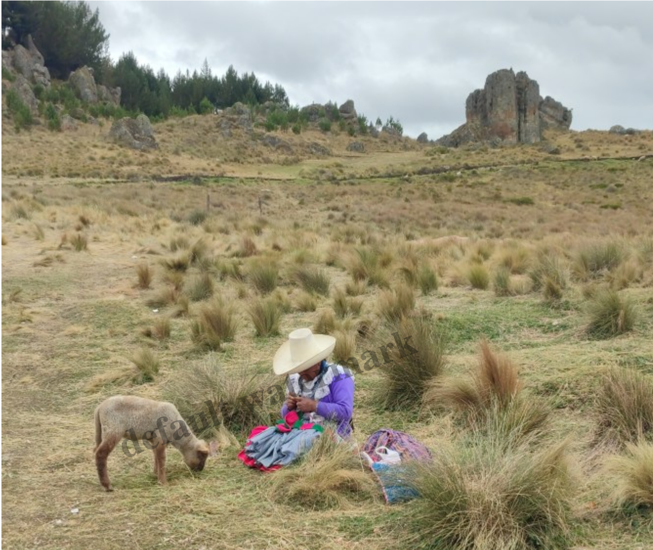
Une des nombreuses femmes indigènes tentant de vendre une photo avec un agneau ou un lama