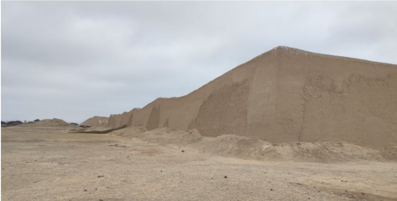
L'enceinte d'une citadelle