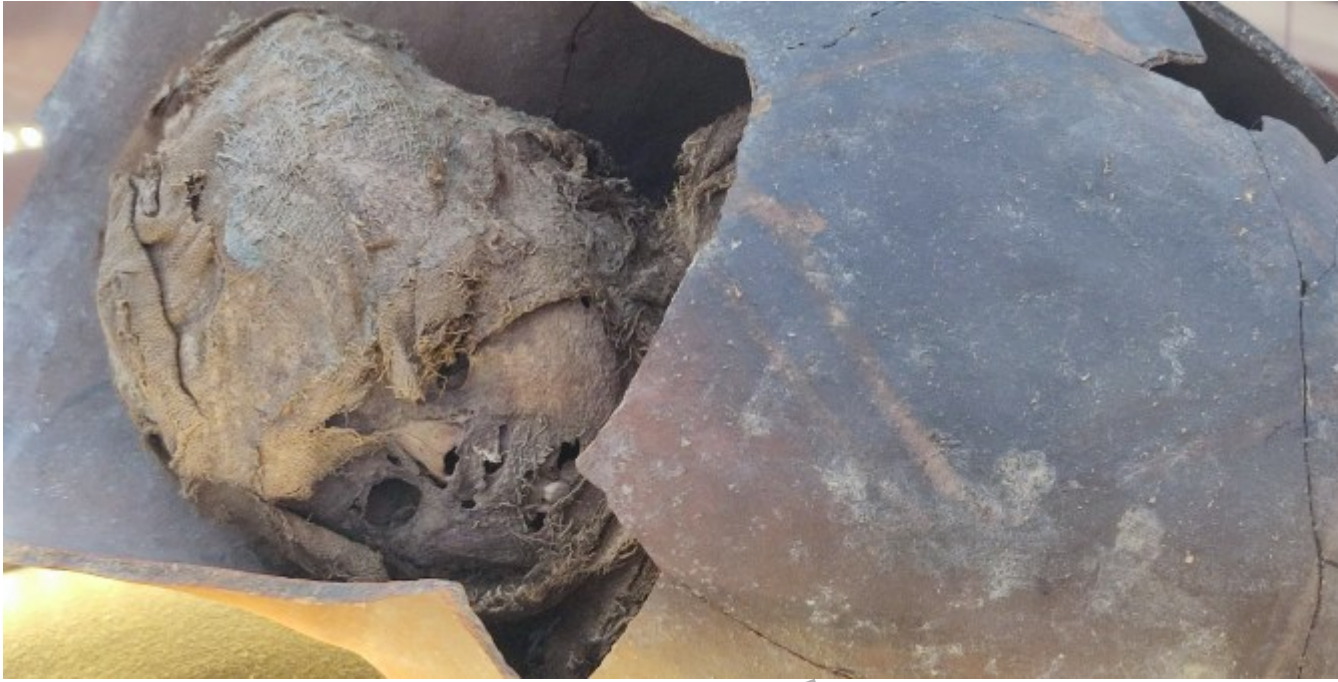
Une momie de bébé, c'est toujours sympa à partager