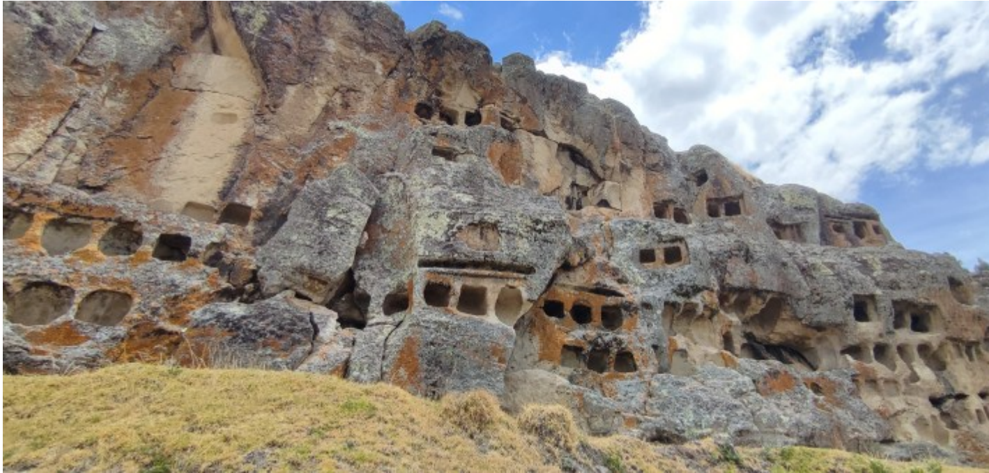
Les Ventanillas de Otuzco

Bien sûr, court passage obligé dans le village de Baños del Inca, ancienne station balnéaire de l'Empereur, où je goûte enfin mon premier ceviche , un plat typique du Pérou mais trouvable depuis la Colombie, à base de morceaux de poisson cru et d'oignons marinés dans du jus de citron.