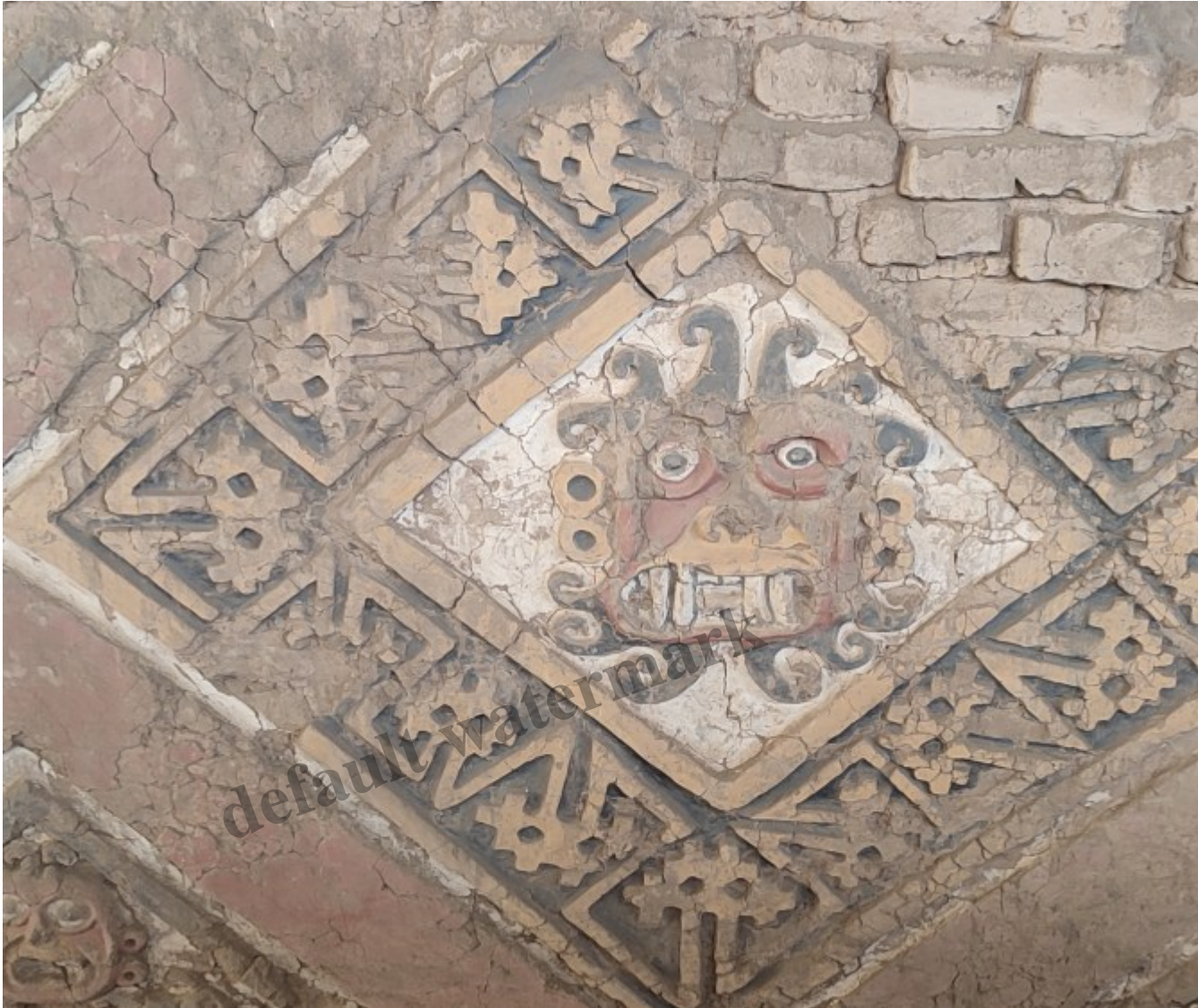
Un des dieux les plus importants, créateur et décapiteur représenté avec des traits de félin, d'araignée et de monstre marin