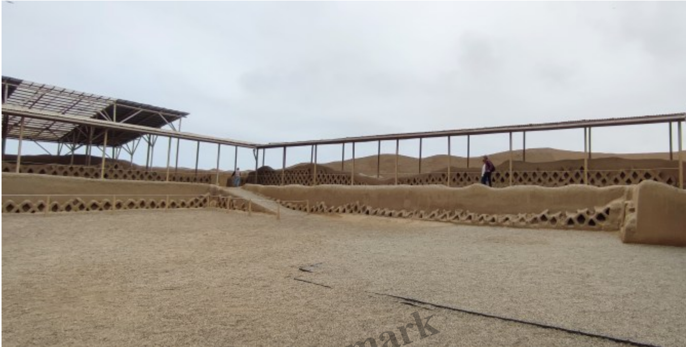
Une salle de cérémonie

Les poissons indiquent le chemin pour progresser dans le temple