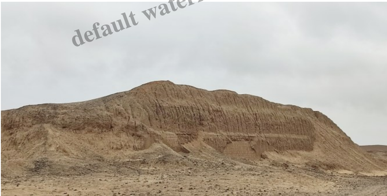
Un reste de mur après les nombreux pillages