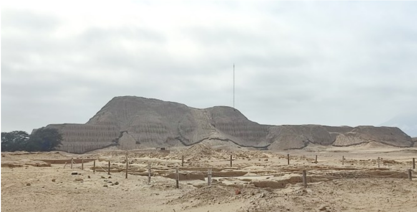
La cité entre les deux temples