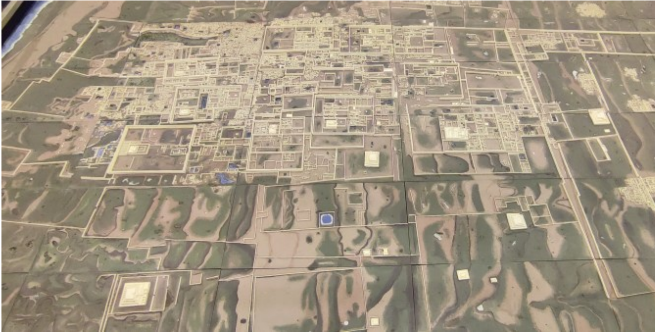
Le plan de la cité de Chan Chan