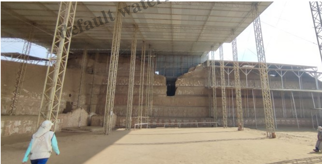
L'extraction des trois premiers niveaux de la pyramide