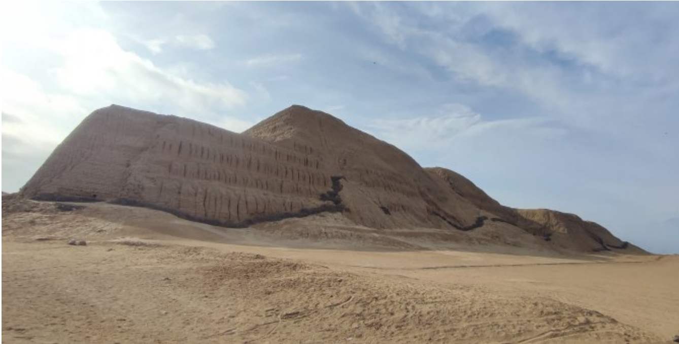
Le temple du Soleil en face