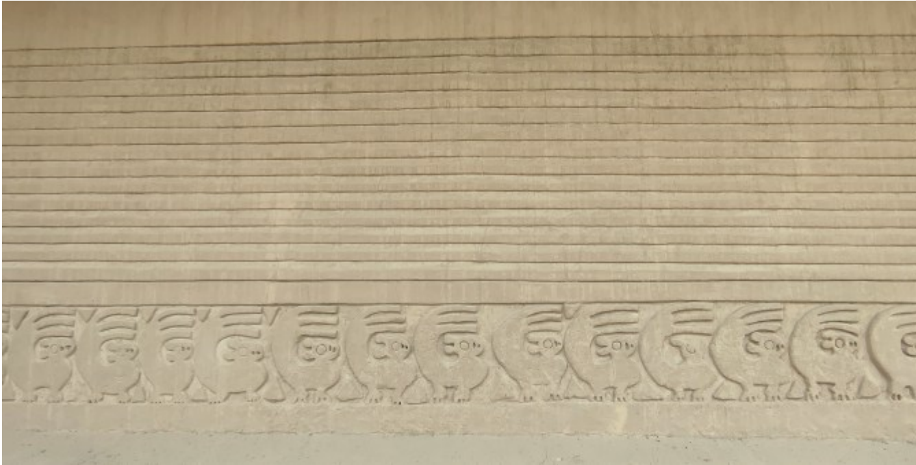
Les écureuils les plus étranges du monde