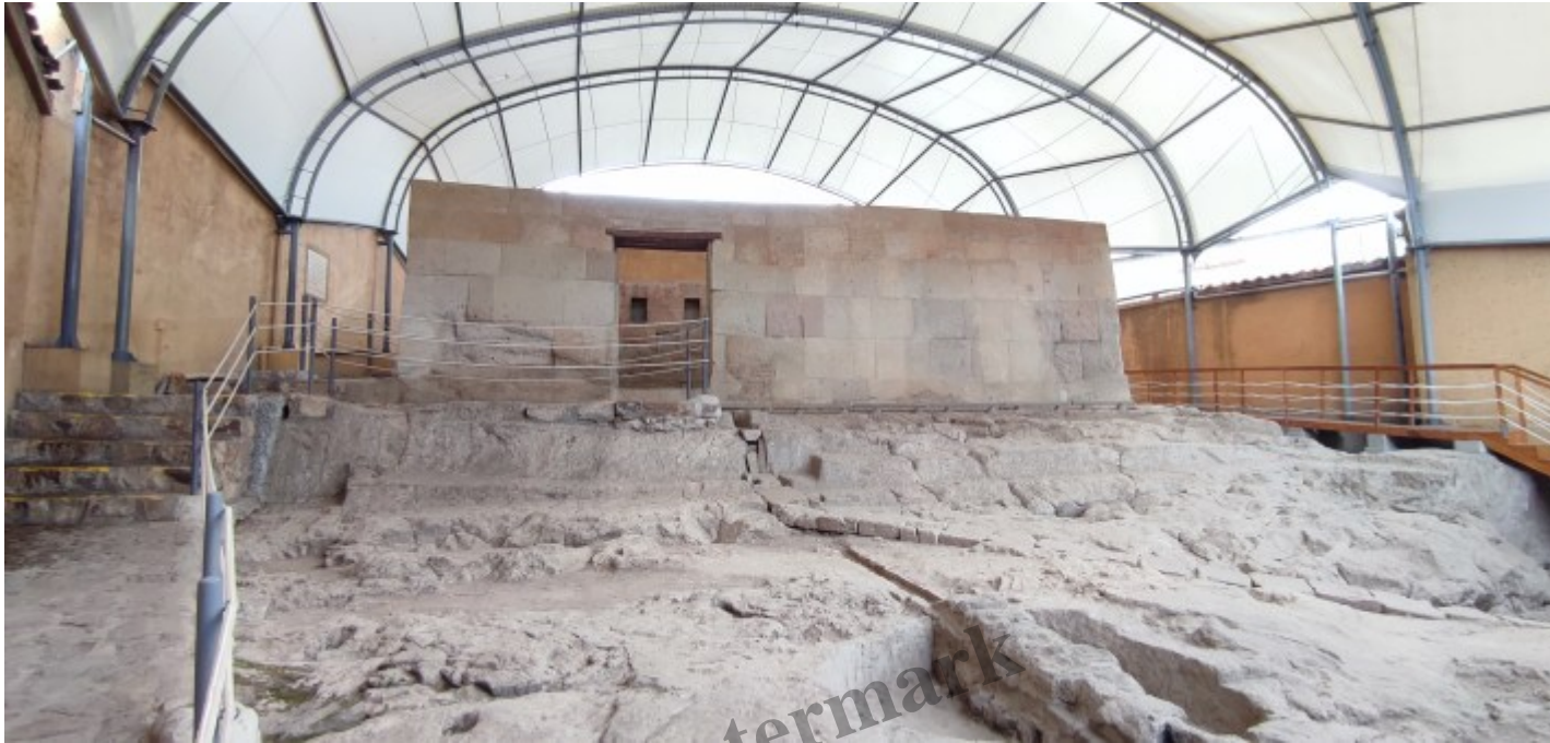
La prison de l'Empereur à remplir de ses trésors.

juger pour inceste, polygamie, adoration de faux dieux et crimes contre le roi, avant de le faire exécuter en 1533.