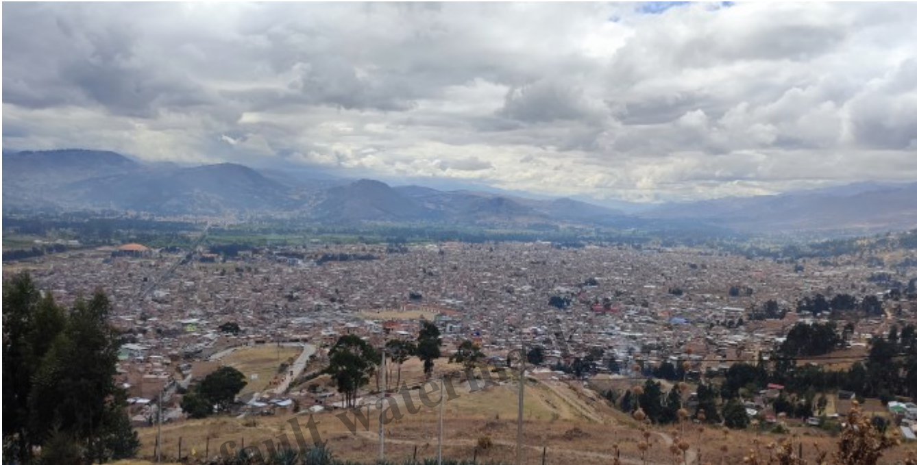
La vue sur la ville de Cajamarca

Plus tard, après la visite de 3 musées et la marche jusqu'au point de vue dominant la ville, je visite le fameux Cuarto del Rescate où était enfermé l'Empereur. Rien de bien impressionnant sans un minimum de contexte que j'ai pu avoir heureusement grâce à mes recherches précédents les visites.