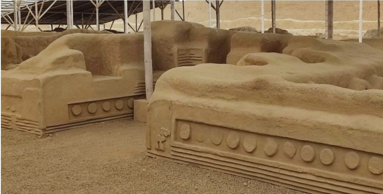
Le symbole de la Lune, très important dans cette culture