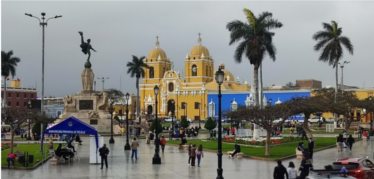
La plaza de Armas (nom donnée à la place centrale de chaque ville en Amérique du Sud) de Trujillo