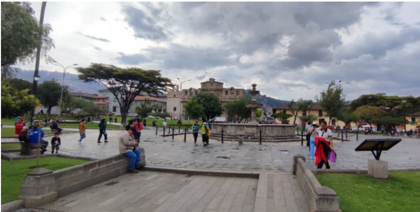
La place de la "bataille" de Cajamarca