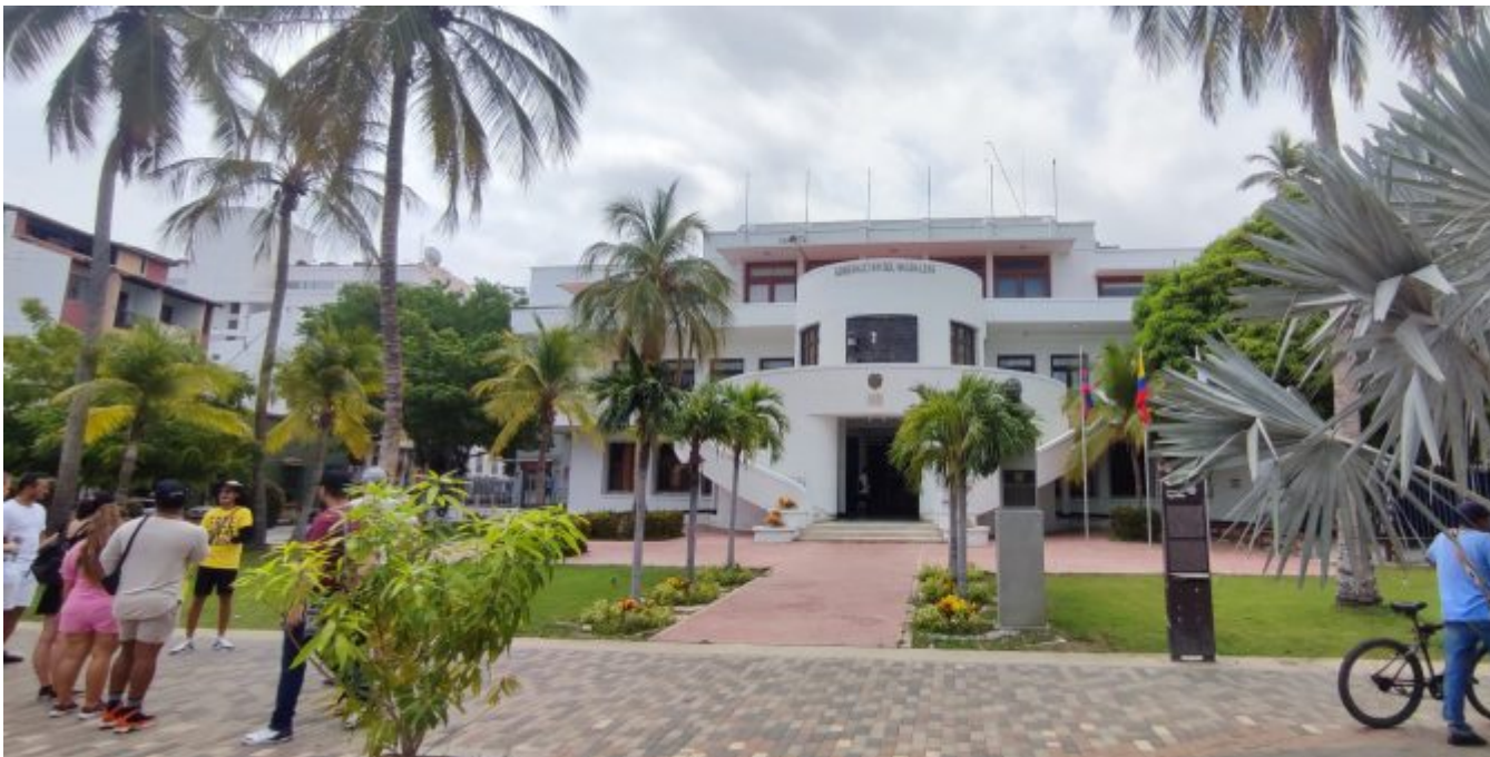
Le gouvernement de la municipalité

Mercredi 18 mai, je réalise mon premier Free Walking Tour en Colombie. Le principe est simple : arpenter les rues d'une ville avec un local pour en découvrir son histoire, ses monuments, ses bonnes adresses et autres anecdotes insolites. Je profite donc de ce billet pour vous parler de mes apprentissages pour une meilleure immersion dans la culture de ce pays. Chef-lieu du département de Magdalena, Santa Marta se développe comme station balnéaire depuis plusieurs années pour les plages qui l'entourent et sa proximité avec la montagne titane.