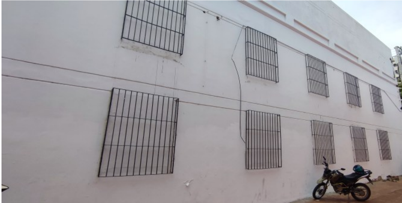
Ah l'art contemporain !