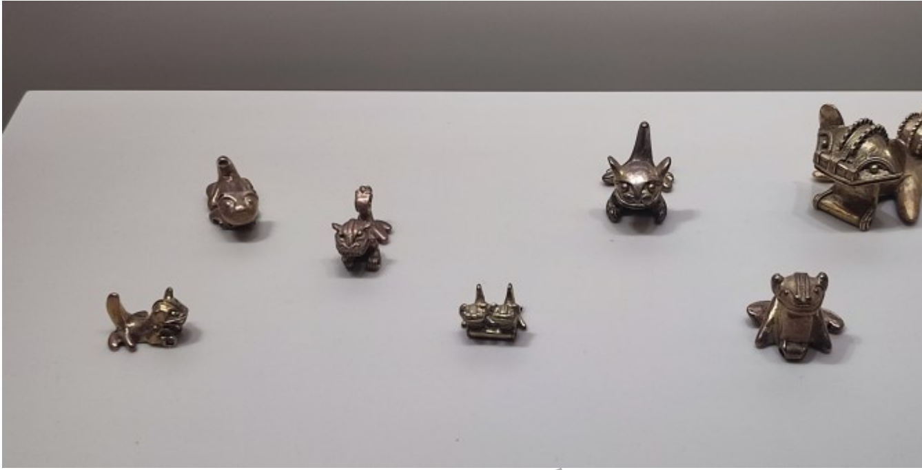
Des créatures mythologiques nées du mélange de différentes espèces