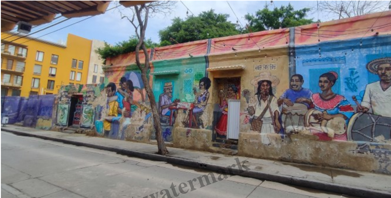
Mélange des peuples...

vigilant. La prostitution, le vol et la mendicité y restent communs mais la ville tente de montrer un nouveau visage notamment grâce au street-art et à de nombreuses initiatives culturelles.