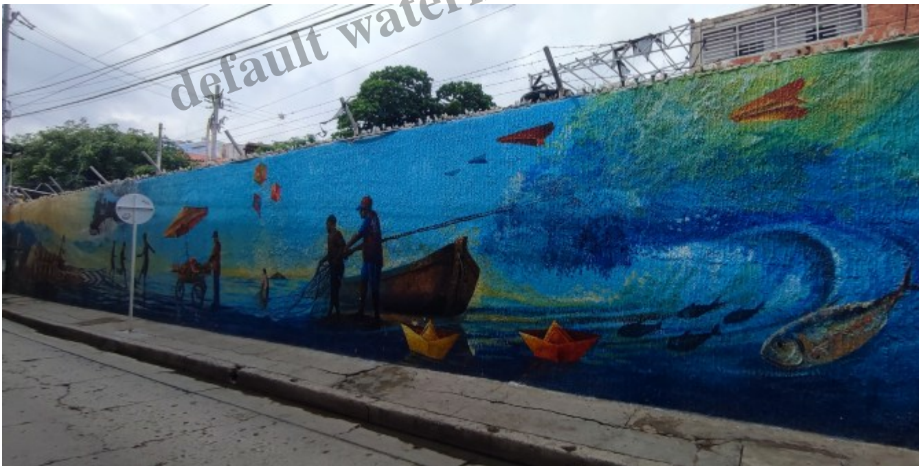
Quelques th mes importants de la r gion