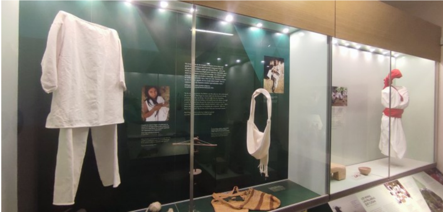
Les habits qu'on retrouve chez une majorité des peuples indigènes de la Sierra Nevada de Santa Marta

Si je remonte dans le temps, c'est quinze ans après la première colonie sur le continent sud-américain que la ville la plus ancienne de Colombie (et deuxième d'Amérique du Sud) fut fondée, en 1525, avec la construction de la maison du conquistador Rodrigo de Bastidas. Les premiers plans d'urbanisme montrent d'ailleurs une première rue avec des parcelles attribuées à chaque personne de l'expédition et bien sûr une église. Sa maison a d'ailleurs survécu à travers les âges et les usages : maison de poste, ambassade, société United Fruit pour l'exportation de bananes, banque, lieu d'accueil de Simon Bolivar avant de devenir le musée de l'or que j'ai pu visiter (photo en couverture).