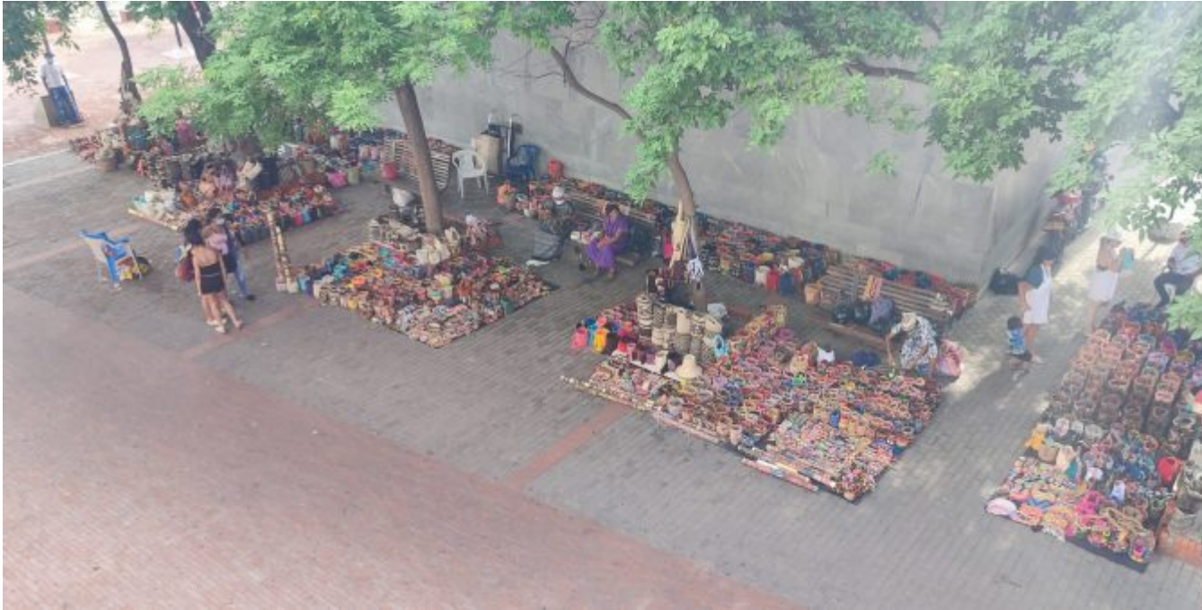
Les créations artisanales indigènes