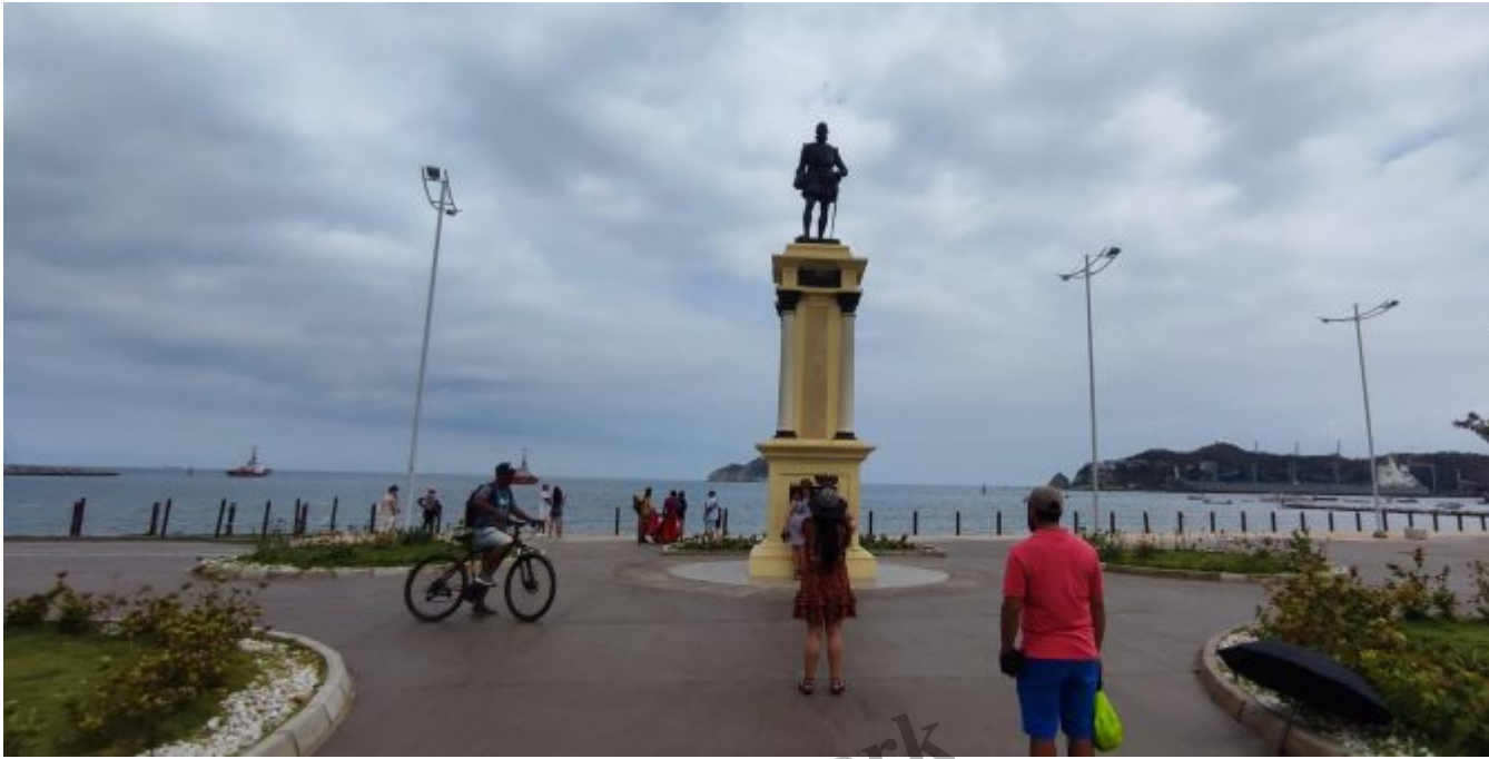
Rodrigo de Bastidas