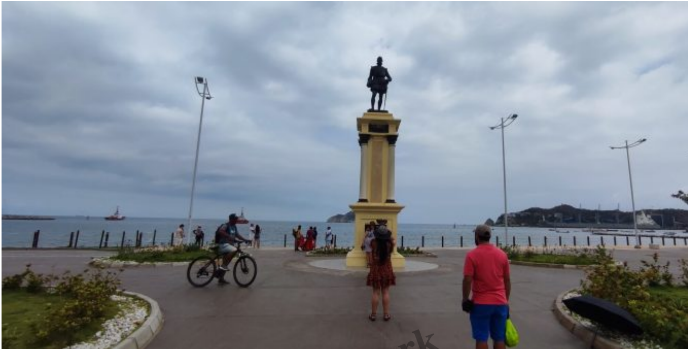
Rodrigo de Bastidas