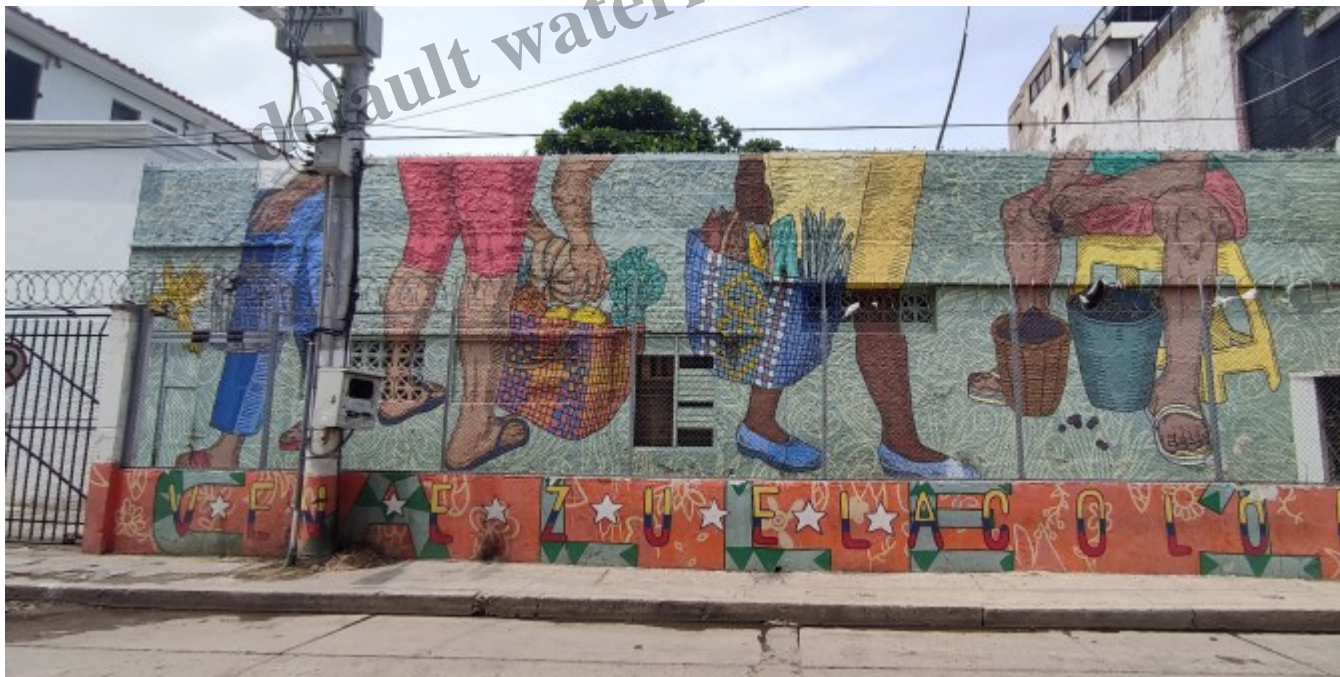
Un graffiti rappelant le m l ange entre toutes les classes et origines (notamment avec la proximit l du V l n l zuela)