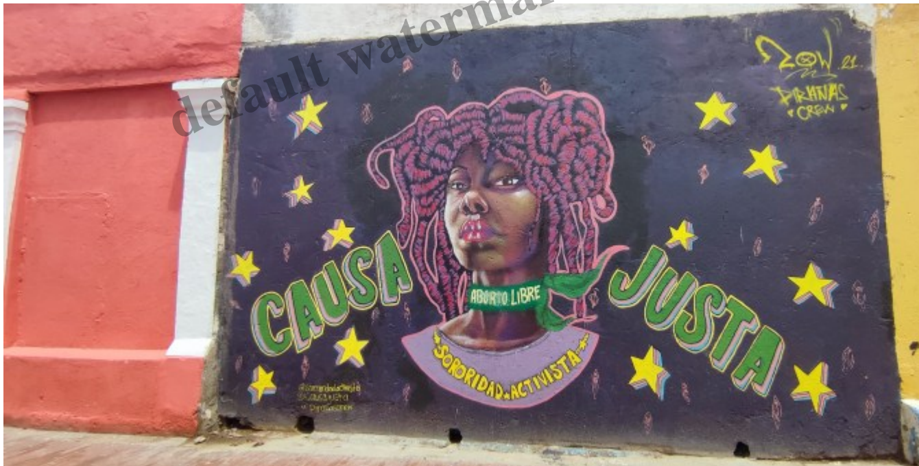
Le premier graffiti fÃ©ministe de la ville