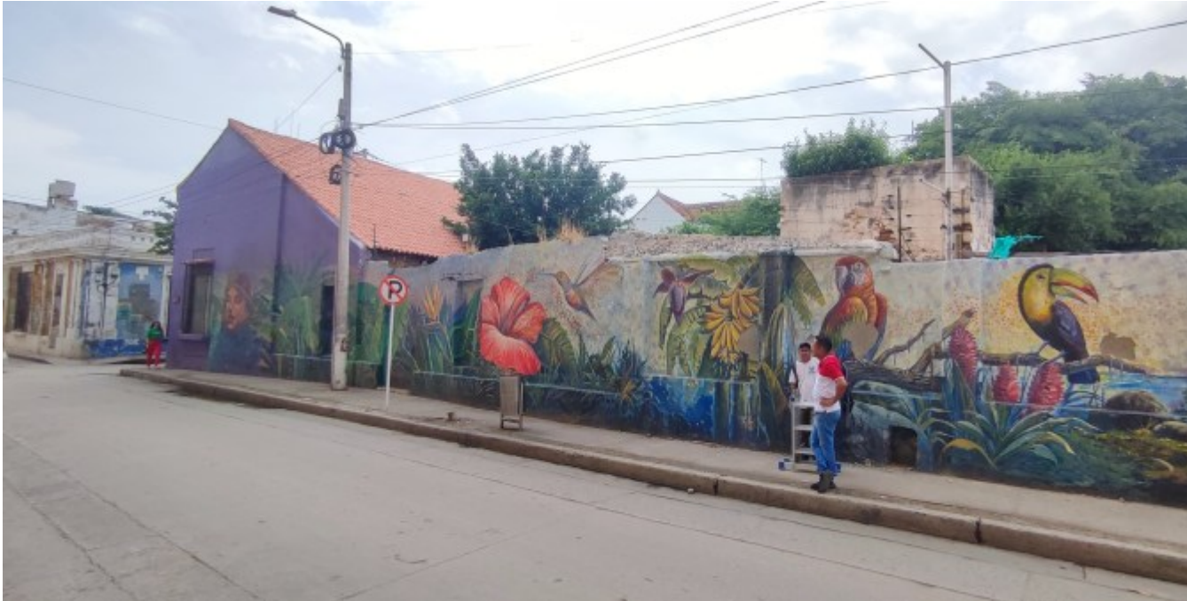
et de la biodiversit .