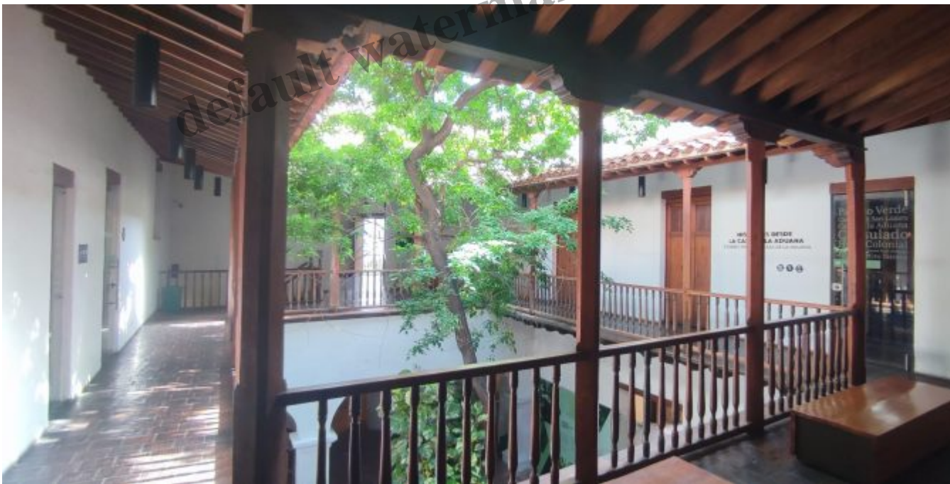
Le musée de l'or

Durant l'ère précolombienne, plusieurs groupes indigènes vivaient dans la Sierra Nevada de Santa Marta dont quatre sont encore présents : les Koguis, les Arhuacos, les Wiwas et les Kankuamos. Ces communautés ont pour croyance que la Sierra Nevada est le cœur du monde. Territoire sacré et source de connaissances, elle doit être protégée dans le respect des traditions et des croyances spirituelles. L'organisation sociale, les habits et la langue varient d'un groupe à l'autre mais tous partagent une vision commune de la création : la Loi de l'Origine. On la retrouve écrite dans de nombreux lieux et elle dicte le mode de vie local.