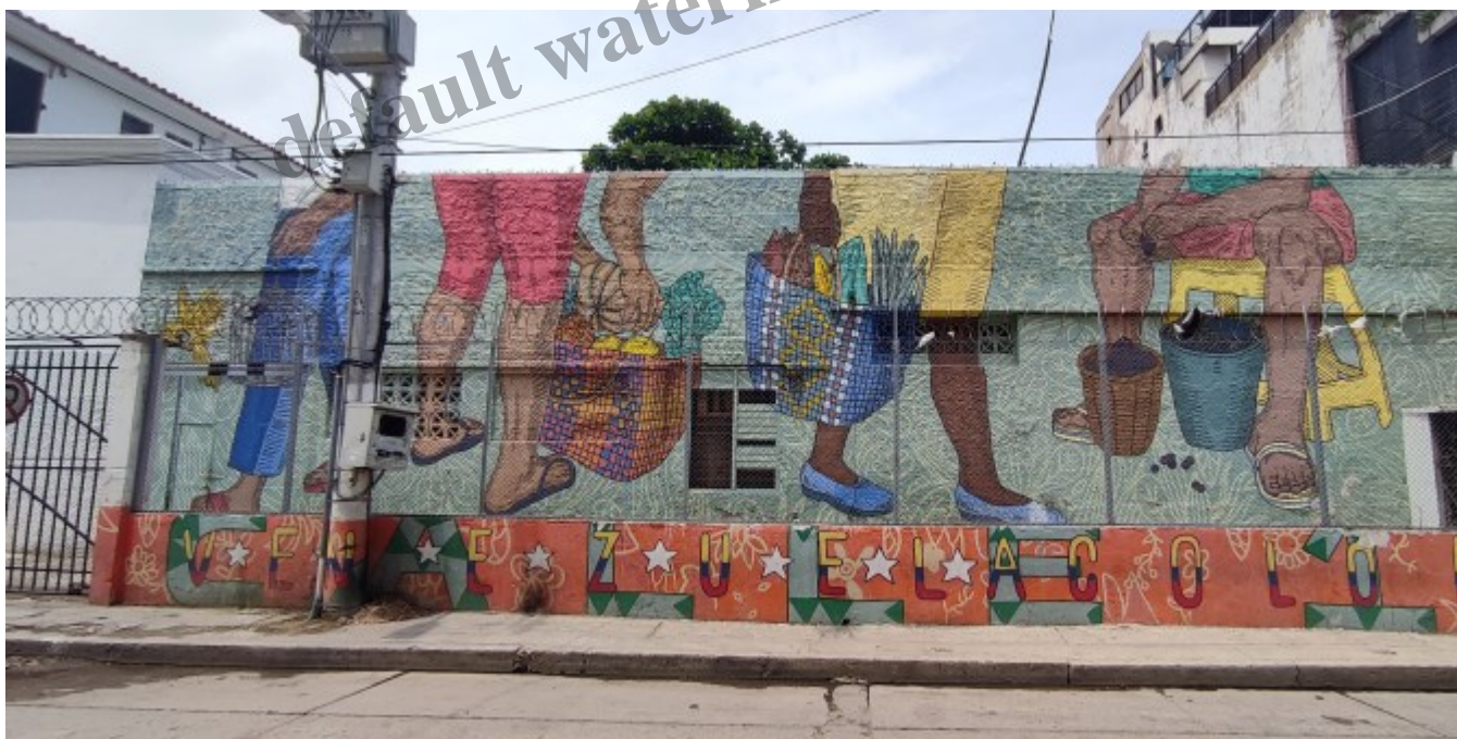
Un graffiti rappelant le mÃ©lange entre toutes les classes et origines (notamment avec la proximitÃ© du VÃ©nÃ©zuela)