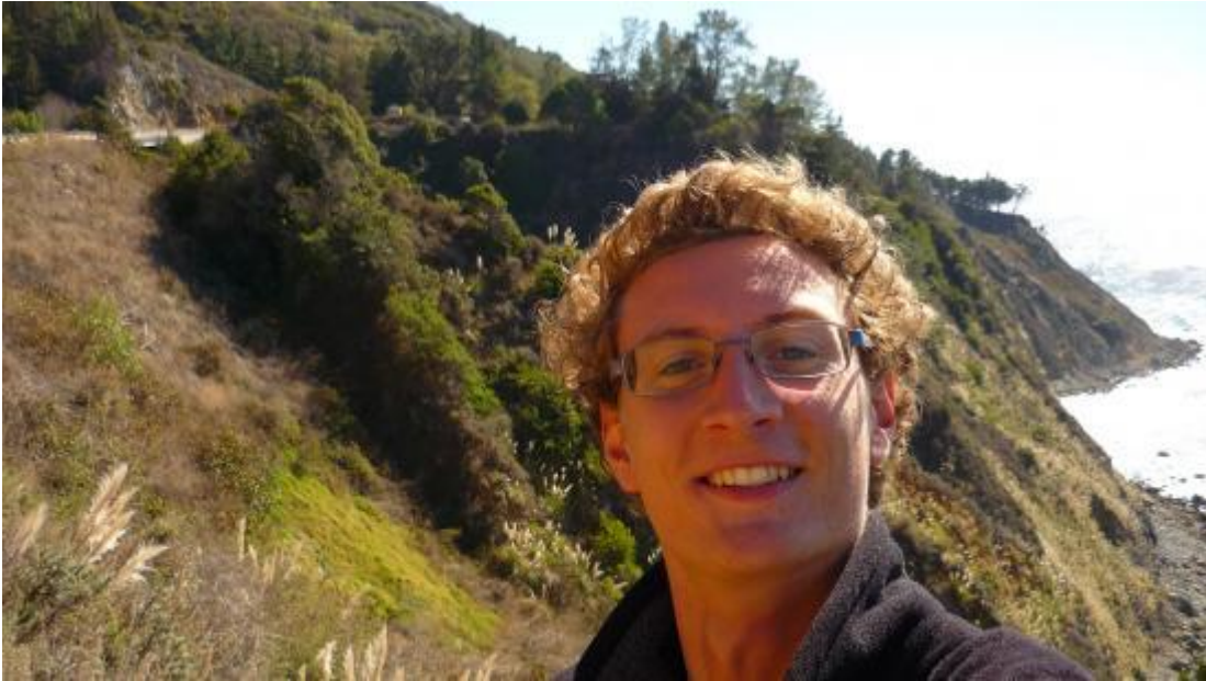
Le premier oiseau migrateur de la famille

Afin de tenter l'aventure à mon tour, j'ai cherché à varier mes façons de voyager au fil des ans en limitant autant que possible mon empreinte carbone et en profitant des merveilles que notre continent a à nous offrir. C'est ainsi que j'ai pu découvrir l'expérience unique de dormir chez l'habitant via le site Couchsurfing , vivre au rythme de la fête avec les auberges de jeunesse, aller aux Free Walking Tour de moyennes et grandes villes... Et bien sûr me retrouver dans bien des situations que je n'aurais parfois pu imaginer (pas toujours plaisantes mais ce sont elles qui font les meilleures histoires avec un peu de recul).