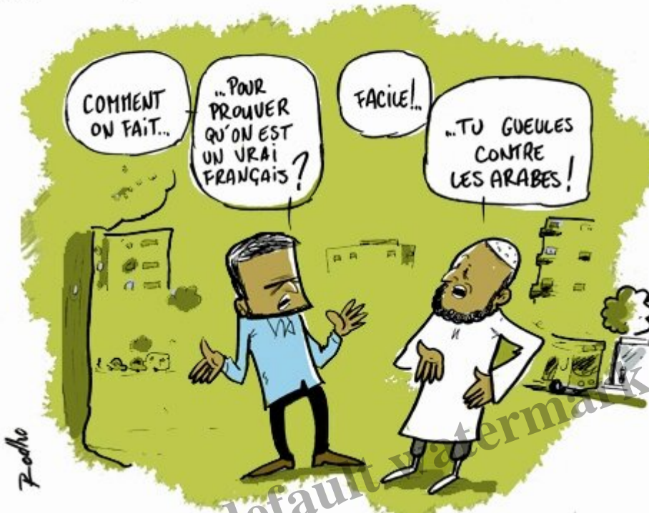
Dessin de presse de Rodho.

Je retrouve mon premier visage familier depuis six mois en voyant devant moi LorÃne, toute souriante malgrÃ la fatigue. Et quel plaisir, notamment aprÃs les derniÃres semaines de retranchement dans ma bulle. Impossible de dormir immÃdiatement Ã vouloir se partager nos aventures, câest avec deux heures de sommeil que nous prenons le bus Ã lâaube pour le petit village de Putre dont le parc naturel avoisinant la frontiÃre bolivienne offre des panoramas que nous souhaitons dÃcouvrir.