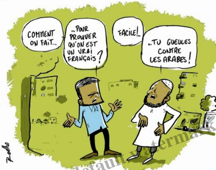
Dessin de presse de Rodho.

Je retrouve mon premier visage familial depuis six mois en voyant devant moi Lorène, toute souriante malgré la fatigue. Et quel plaisir, notamment après les dernières semaines de retranchement dans ma bulle. Impossible de dormir immédiatement à vouloir se partager nos aventures, c'est avec deux heures de sommeil que nous prenons le bus à l'aube pour le petit village de Putre dont le parc naturel avoisinant la frontière bolivienne offre des panoramas que nous souhaitons découvrir.