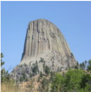
Stage aux États-Unis, 2011

M'attendant jusqu'ici surtout aventure en Europe, je réfléchissais de plus en plus à me lancer dans un long et lointain voyage sans date de retour. La tentation de profiter d'un nouveau principe pour travailler un langage que je ne maîtrise pas et découvrir à la traversée d'un unique continent différents climats, peuples et cultures me plaît. Véritable défi personnel, me voilà avec l'objectif de passer une grande partie de 2022 en me rendant de Bogotá; Buenos Aires en passant par Ushuaia. Si suite il y a, elle s'improvisera plus tard. Mon but est de passer un maximum de temps avec l'habitant, de suivre les recommandations sur place (je tiens à ne pas savoir ce qui m'attend quand je découvre un lieu), de laisser la place à l'inconnu.