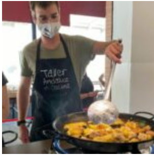
Tour d'Espagne, 2021

une façon de se connaître, au plus près de ses besoins et ses envies.