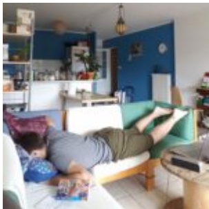
Traversée des Balkans, 2018