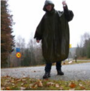
Tour d'Europe du Nord et de l'Ouest, 2012