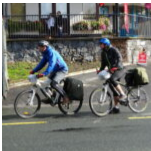
Tour d'Irlande en vélo, 2015